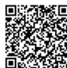
コールドテーブル

各製品の詳細につきましては上記 QR コードから fujimak ホームページにてご覧いただけます。