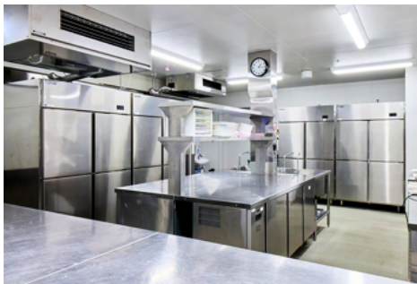
コールドキッチン

コンビオープン（スチコン）は、1/1サイズの ホテルパンが20段同時に焼成できる容量です。 3台使用されています。