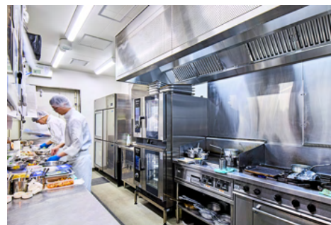
ラウンジ用キッチン