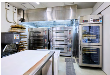
ベーカリールーム

「キッチンリンク・クラウド」がホテル全体の 184台分の冷蔵庫、冷凍庫の温湿度の自動計測・ 自動記録を担っています。