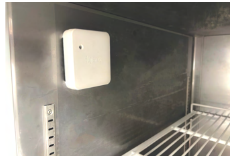
コールドキッチン

フジマックの冷蔵庫は取っ手のない一体型ドアデザインです。クラウド型温度管理システム「キッチンリンク・クラウド」も導入されています。