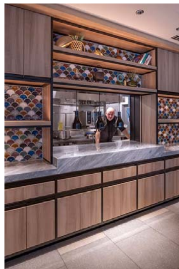
レストラン厨房のディシャップカウンター。総料理長が撮影に応じてくださいました