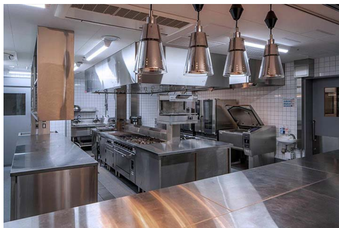
バンケット厨房は、主に4つの宴会場の調理を担います