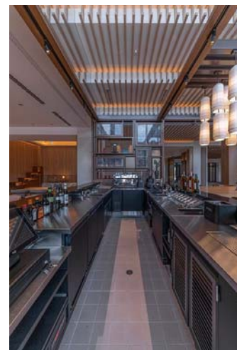
「the BAR Yoyama (夜車山)」。厨房機器を fujimak がお納めしました