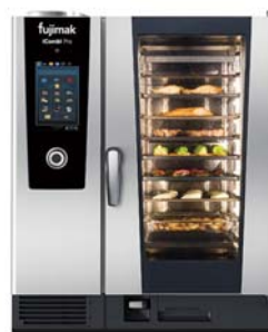
コンビオープン iCombi Pro