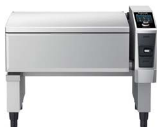
バリオ シリーズ / 大容量パン