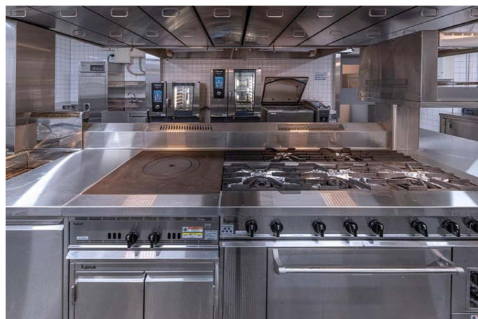
バンケット厨房にはコンビオープンとバリオシリーズ大容量パンを配備