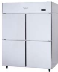
冷蔵庫・冷凍庫・冷凍冷蔵庫