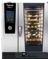
コンビオープン iCombi Pro