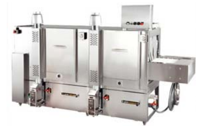
コンベアタイプ洗浄機