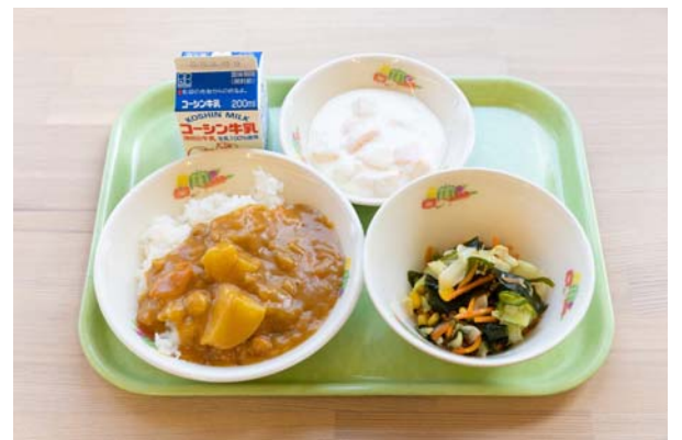
取材日の給食。人気ナンバーワンだというチキンカレーライスのほか、海藻サラダ、フルーツのヨーグルト和え、牛乳です。ご飯は流山産コシヒカリの新米