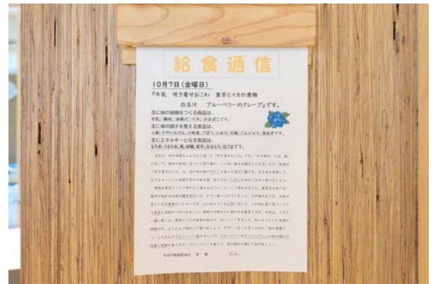
給食通信。同じ内容がおおぐろの森中学校のHPでも公開されています

fujimak は、おおぐろの森中学校について、調理場の設計を担当させていただきました。コンビオープンや冷蔵・冷凍庫、食器洗浄機などの機器もご使用いただいています。「給食に限った話ではありませんが、安全が第一です。本校の調理場は、一流ホテルの厨房に引けをとらないくらい、先進的な食品衛生のノウハウが反映されていると聞いています」（前川校長）。